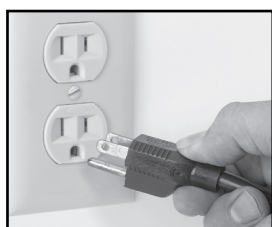
Fig. 5-1 Correct

CETTE MACHINE EST FOURNIE AVEC UNE FICHE DE MISE À LA TERRE TRIPOLAIRE. LA PRISE DANS LAQUELLE CETTE FICHE EST BRANCHÉE DOIT ÊTRE MISE À LA TERRE. SI LA PRISE NE DISPOSE PAS DU TYPE DE TERRE CORRECT, CONTACTEZ UN ÉLECTRICIEN. NE COUPEZ OU NE RETIREZ EN AUCUN CAS LA TROISIÈME BROCHE DE TERRE DU CORDON D'ALIMENTATION ET N'UTILISEZ JAMAIS DE FICHE D'ADAPTATION (Fig. 5-1 et Fig. 5-2).